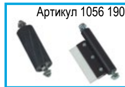
Артикул 1056 190

Модуль для бесцентровой шлифовки труб. Мощность двигателя 300 Вт.